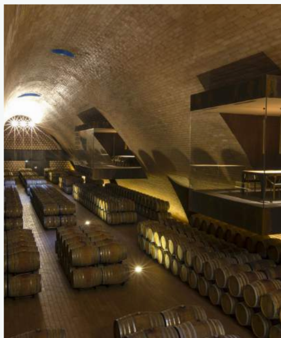
La cantina Antinori pieno di barriques della European Coopers Hungary.